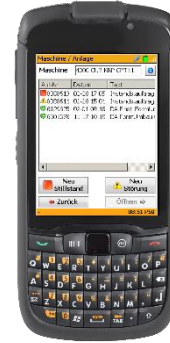
Instandhaltungsaufträge (Variante Tablet-PC)