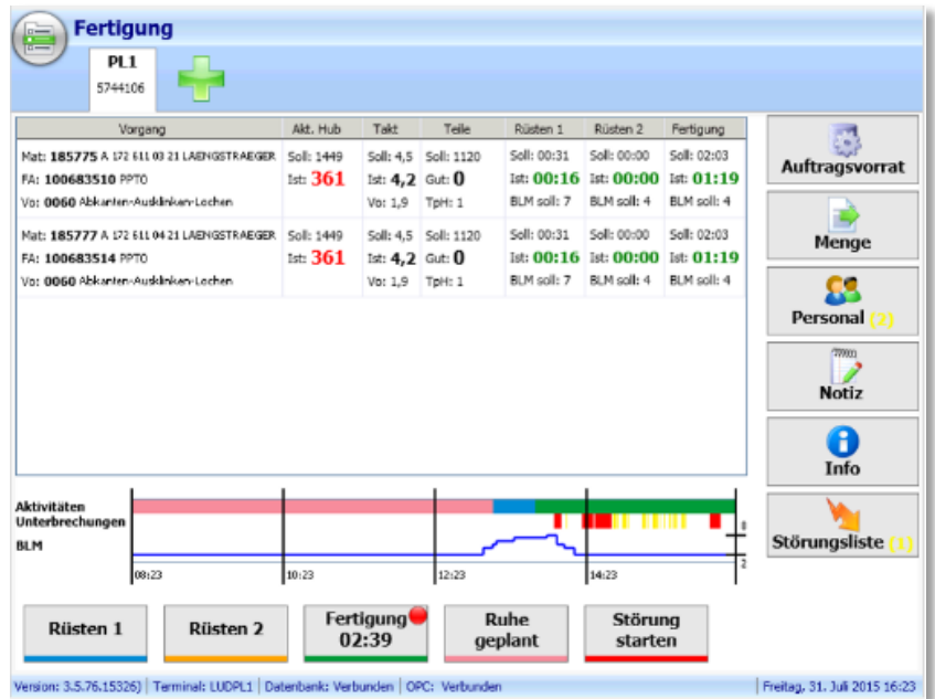
Fertigungsdaten in Echtzeit

Das System unterstützt auch die Ermittlung verschiedener Kennzahlen wie zum Beispiel OEE (Overall Equipment Efficiency), TPI (Total Productivity Indicator) und MCE (Manufacturing Cycle Effectiveness).