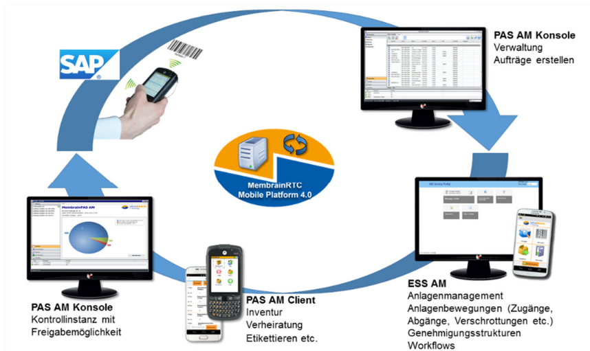
Kreislaufdiagramm einer Software-gestützten Anlageninventur mit MembrainPAS AM und MembrainESS AM