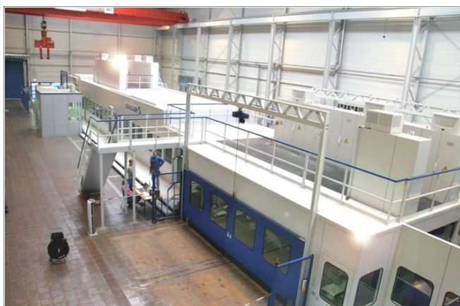
Platinenproduktion bei ThyssenKrupp Umformtechnik: Automatisierter und fehlerfreier Produktionsfluss

Fertig geschnittene Stapel werden durch die Anlagensteuerung automatisch aus der Anlage transportiert und als Wareneinheit (WE) gebucht. Dem RTC-Client stellt die Steuerung via OPC-Schnittstelle Fertigungsauftrag, Materialnummer und Menge zur Verfügung. Der Client generiert daraus eine Wareneingangsbuchung in SAP inklusive einer neuen Lagereinheit. Das daraufhin aus SAP generierte Etikett wird auf einem Drucker produziert, der direkt neben dem Ausschleustor steht, durch das der Platinenstapel die Anlage verlässt. Damit sind im gesamten Produktionsfluss bis auf das Anbringen des Etiketts keinerlei Benutzereingriffe mehr erforderlich, und fehlende Buchungen oder solche mit falschen Mengenangaben sind weitgehend ausgeschlossen.